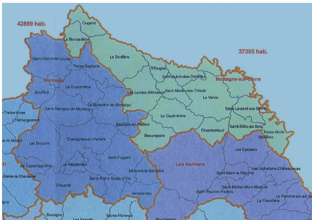
Cantons remodelés qui rattacheraient Cugand à Mortagne s/Sèvre